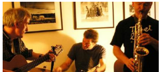
Bulle de Jazz

du groupe Amnesty International Thiers de la revue Silence.