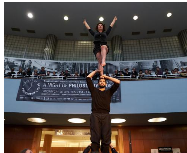
NEW YORK, Nuit des idées 2018