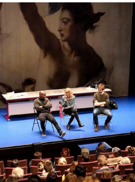
RENNES, Nuit des idées 2018