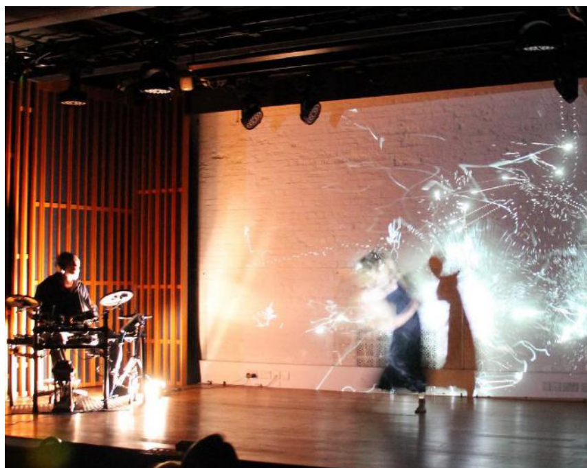
HONG KONG, Nuit des idées 2018

Une nuit sans barrières où les idées traversent les frontières, où chaque forme d'expression trouve sa place, où les cultures se partagent et les générations futures s'éveillent, une nuit pour lancer des alertes, rappeler le droit à la parole, une nuit ensemble face au présent.