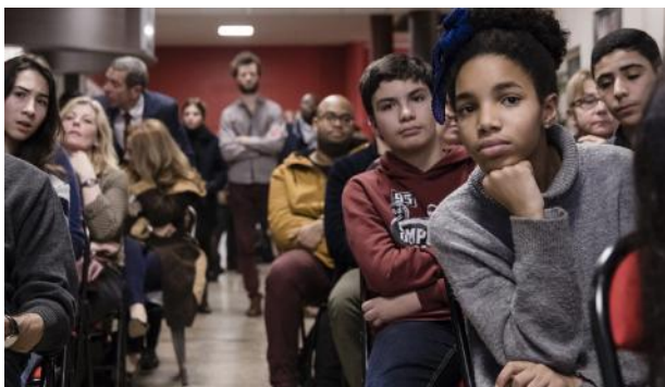
BONDY, Nuit des idées 2018