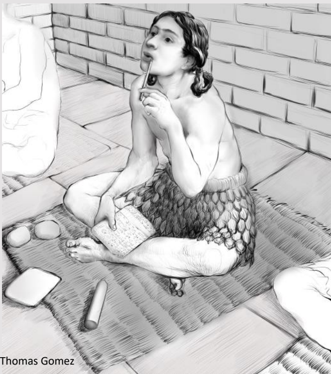
Dessin : Thomas Gomez

L'histoire de l'écriture fait partie de l'aventure humaine. Après être allés à la rencontre des Maasaï, des habitants de la Grotte Chauvet, des Indiens d'Amérique du Nord, nous vous proposons de questionner l'écriture à travers le temps, ses supports, ses outils. Elle concerne tous les peuples et toutes les cultures : l'Homme trace des signes pour fixer, prolonger sa pensée et sa parole, communiquer de manière durable avec ses semblables.