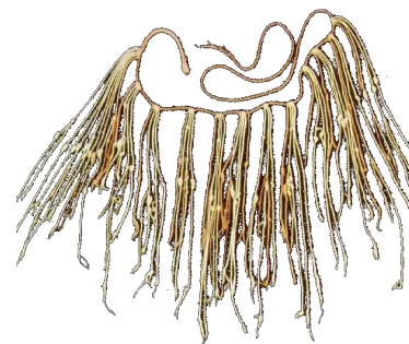
« Quipu Incas »

Les Mayas avaient développé, dès le 3 e siècle avant JC, une écriture très sophistiquée composée de 1200 signes, les glyphes . Restée longtemps comme une énigme, l'écriture maya est maintenant déchiffrée à 80%. Les Incas, arrivés cinq siècles après la fin de la civilisation maya, n'avaient pas d'écriture. On a longtemps pensé cela, mais peut-on vraiment l'affirmer ? Pachamama propose de découvrir ces deux systèmes.