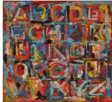
« Alphabet » de Jasper JOHNS

Nous vous parlerons des lettres et des mots intégrés à des œuvres d'art, ou devenus œuvres d'art. Des calligrammes aux lettrines, des phylactères aux graffitis, en peinture, en sculpture, en lumière ou en performance, on vous en fera voir de toutes les couleurs et de toutes les formes.